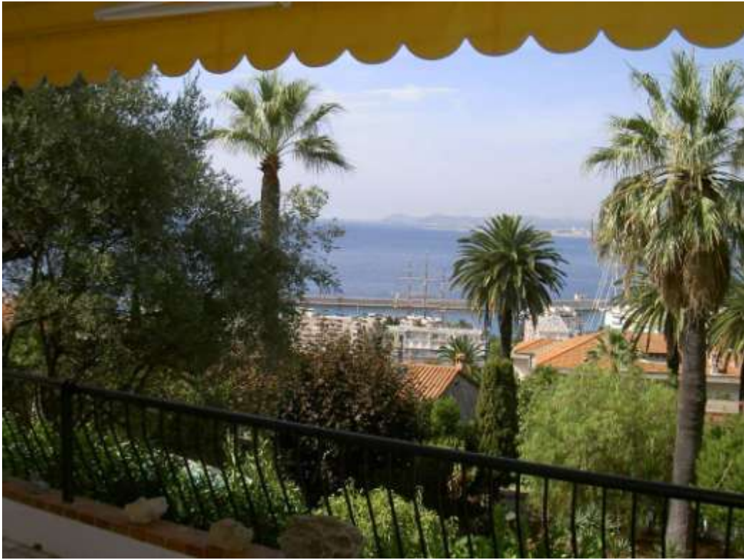
Vue à gauche (vers le cap d'Antibes)