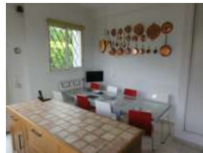
o 8 persone

Refrigerator, congelatore (263l), forno pyrolyse, forno a microonde, lavastoviglie, piano di cottura elettrico 4fuochi, acquaio doppio, armadi a muro, LCD televisione, tavola e ferro da stirare.