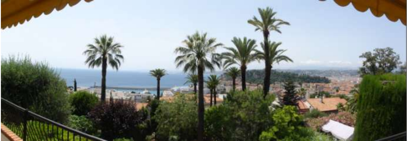
Vue d'ensemble (panoramique)

MONT-BORON (au dessus du port de Nice, à 1 km) dans une allée privée en impasse A 1 km de la plage de La Réserve, à 2,5 kms du centre-ville (place Masséna) Vue Mer, Colline du Château et Ville Location à la semaine pour 6 à 8 personnes