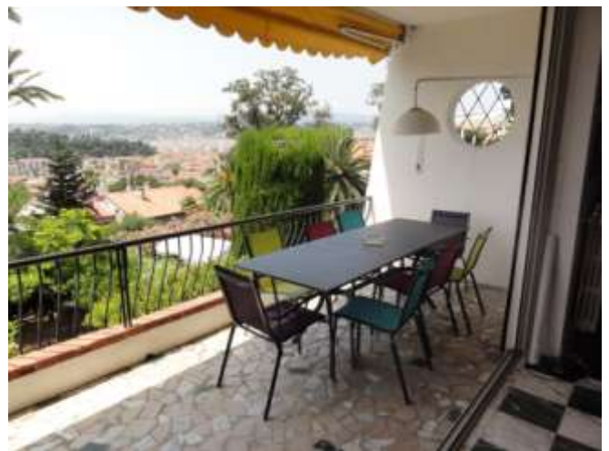
... ou pour 8 avec son allonge