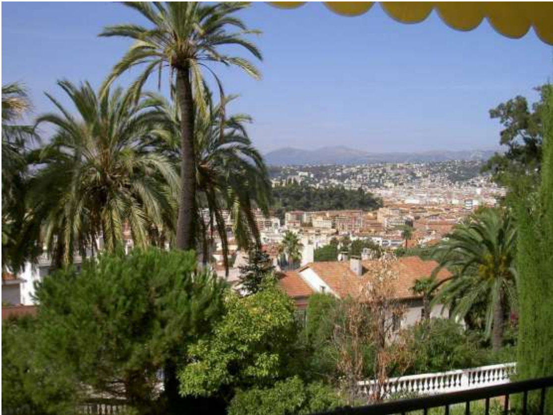
Vue à droite (sur le château, la ville et les montagnes)