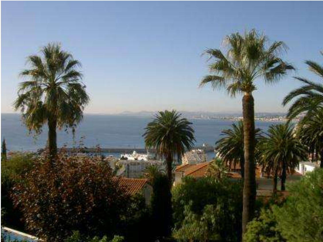
Vue à gauche (vers le cap d'Antibes)