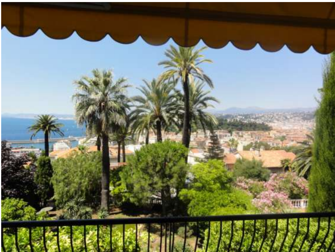
Vue centrale : sur le château