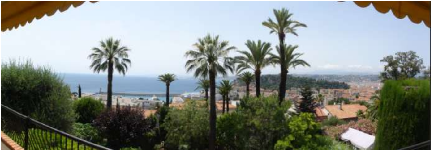
Vue d'ensemble (panoramique)

MONT-BORON (über dem Hafen von Nizza, 1 km entfernt), in einer Privat-Allee ohne Durchfahrt (Sackgasse) ; Badestrand "La Reserve" ca.1 km entfernt, Stadtzentrum in 2,5 km Entfernung Sicht auf das Meer, den Schlossberg und die Stadt. Vermietung per Woche für 6 bis 8 Personen