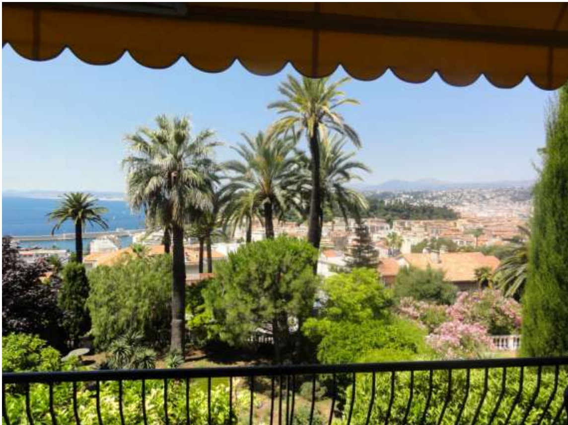
Vue centrale : sur le château