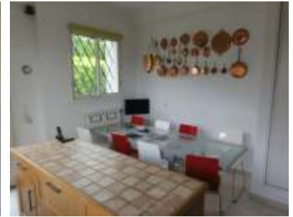
...oder 8 Personen

Wichtigste Ausrüstungselemente : grosser Kühl-Gefrierschrank (263 Liter), Pyrolyse-Ofen, Mikrowellenherd, Geschirrspülmaschine, 4 elektrische Kochplatten, Doppel-Spülbecken, Absaughaube, Schränke mit grossen Räumlichkeiten, doppelte Arbeitsfläche (mittige Anordnung), kleiner Fernseher, Bügeltisch und -eisen, usw.