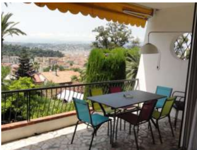
Ein Tisch für 6 ...