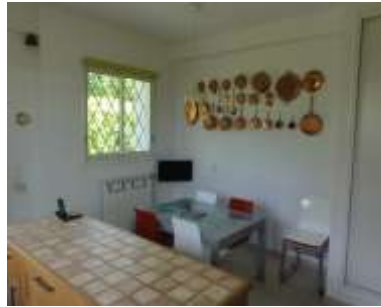
Für 4 ...

Die Küche besitzt eine Essecke (Tisch von 90 x 120 cm, vergrößerungsfähig auf 240) die erlaubt bis zu 8 Gäste zu empfangen.